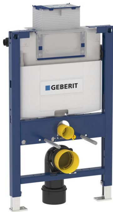
Fig. 2 Geberit Duofix Omega Figur: Geberit AS