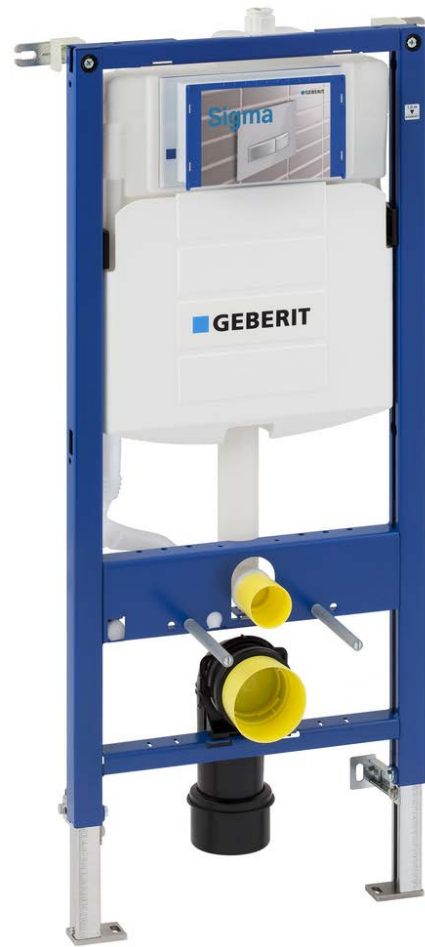
Fig. 1 Geberit Duofix Sigma

Duofix Sigma og Duofix Omega innbyggingsssystemer kan benyttes i badetrom og toalettrom der man ønsker skjult montering av sisterna. Når innbyggingsystemet monteres som beskrevet i pkt. 6, vil systemet tilfredsstillende krav til vedlikehold og utskifting av sisterna, sikkerhet mot eventuell lekkasje og synliggjøring av eventuelt lekkasjevann.